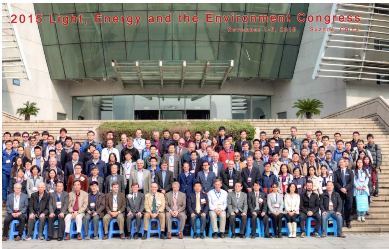
蘇州大学における OSA の国際会議参加者 (2015 年 11 月 2 日～5 日)

アメリカ光学会(Optical Society of America ; OSA)が開催する Light, Energy, and the Environment Congress が 11 月の 2 日から 5 日にかけて、中国・蘇州大学 (Soochow University) の Dushu Lake Campus で開催されました。この国際会議は Optics and Photonics for Energy & the Environment (E2)、Optical Nanostructures and Advanced Materials for Photovoltaics (PV)、Optics for Solar Energy (SOLAR)、および Solid-State and Organic Lighting (SOLED) の 4 つのカテゴリー会議から構成され、光学という共通の立場から環境の光学計測や光学素子のエネルギー利用についての幅広い分野の研究者が最新の成果や情報を共有する場となっています。私は E2 の最初のセッション冒頭で、Optical Monitoring of Pollution and Greenhouse Gases inside the Atmospheric Boundary Layer (大気境界層における汚染気体と温暖化気体の光学モニタリング) と題した講演を行いました。E2 には中国、オーストラリア、ドイツ、韓国など各国の第一線の研究者も参加し、活発な議論が行われました。