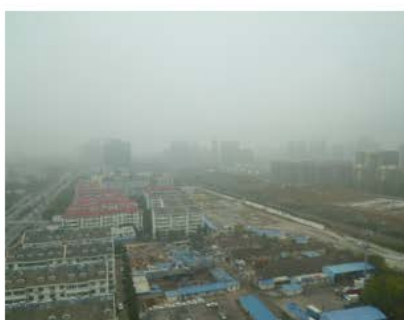
合肥の町の大気状況