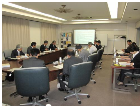
第5回環境リモートセンシング研究センター外部評価委員会